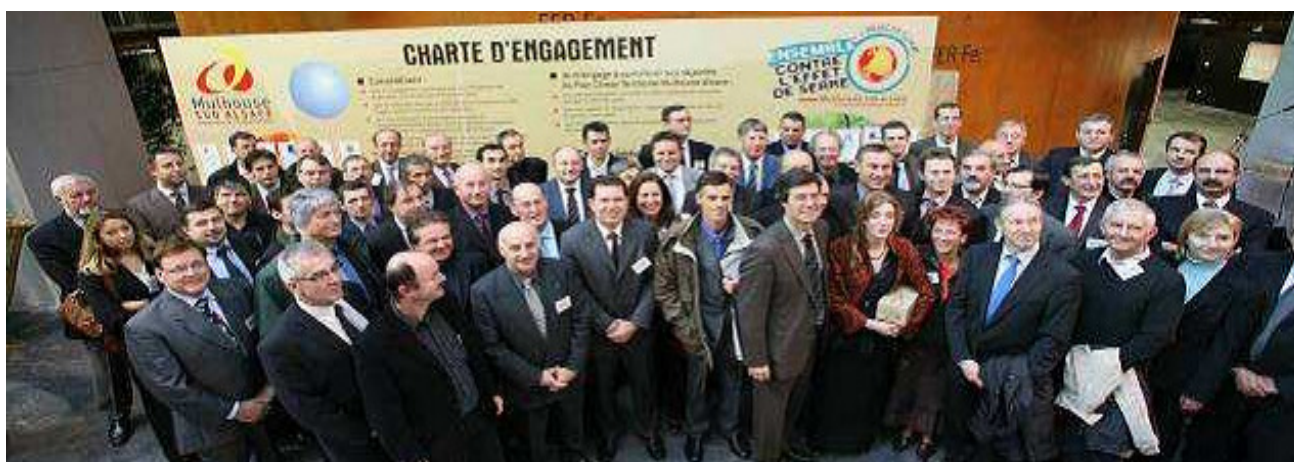
Foto: Podpis Klimatskega plana

Demokracijo sodelovanja zagotavljajo z vzpodbujanjem izmenjav med vsemi, ki jih ta plan zadeva, posebej med prebivalci in potencialnimi partnerji. Predlogi prebivalcev so predmet diskusije in se lahko razvijejo v konkretne ukrepe za zmanjšanje emisij CO 2 . Svetovalni svet je prav tako odgovoren za izvedbo, spremljanje projekta in evalvacijo klimatskega plana.