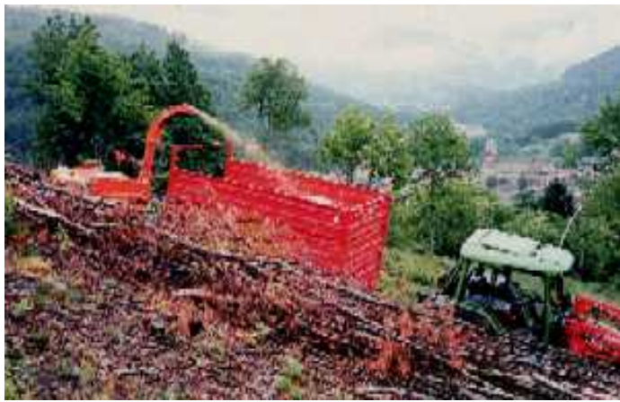
TRACTOR, TOCATOR MOTORIZAT MOBIL SI DOUA REMORCI BASCULANTE