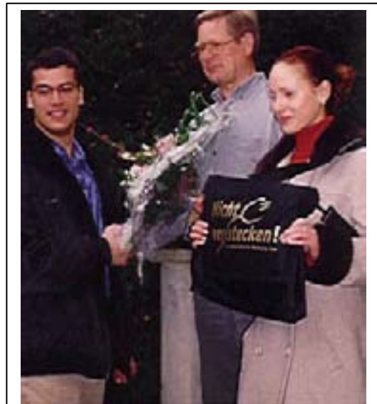
Übergabe des 20.000sten Gutscheines in Verbindung mit einem Geschenk