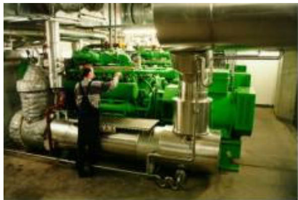
Planta de cogeneración en el Jardín Botánico

En el año 2002 había 70 plantas descentralizadas de cogeneración cuya producción total ascendía a 24,000 kW de electricidad. Los motores, alimentados sobre todo por gas natural, van desde los 5 kW hasta los 4000 kW. Las plantas de cogeneración pequeñas y medianas funcionan en edificios municipales, jardines de infancia, residencias de ancianos, en la industria y en algunas redes de calefacción urbana de oficinas y hospitales. La cogeneración se combina a menudo con los aparatos de aire frío (tri-generación). Una planta de cogeneración de 50 kW en una residencia de ancianos utiliza un intercambiador de calor por condensación. La planta de cogeneración de 800 kW del jardín botánico se combina con una nueva "unidad de condensación de alta temperatura" basada en un proceso de absorción para conseguir una eficacia total de más del 95%. En una prueba práctica sobre el terreno, la compañía eléctrica MAINOVA hace funcionar un motor Stirling de 4-9 kW. Hay una pila de combustible 200 kW en ONSI y una turbina del micro-gas de 100 kW en dos piscinas.