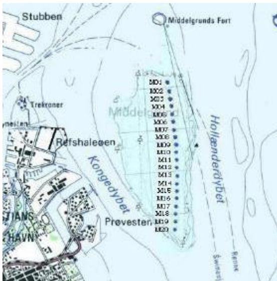
Plan rozmieszczenia geograficznego