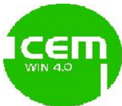
Logotipo del Programa

Este programa se está utilizando desde 1997. En estos momentos hay disponibles cuatro versiones diferentes y mejoradas, la última de las cuales se puso en marcha en marzo de 2002. El software se estructuró, en su versión original, en cuatro módulos, mientras que la última versión (WinCEM 4.0Euro) es el resultado de una serie de mejoras y contiene un menú con 5 opciones principales: informes, alarma, importación de datos, simulador de tarifas energéticas y red local.