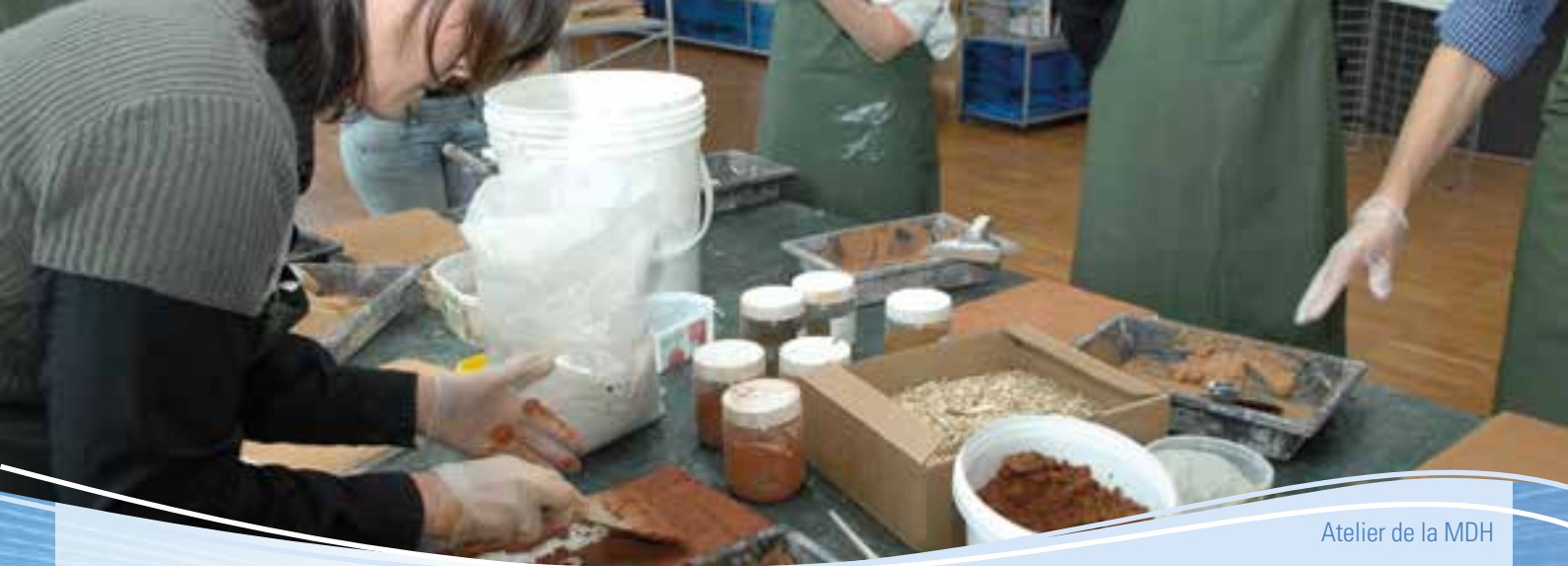
Atelier de la MDH