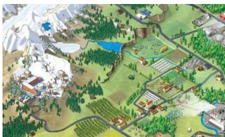
Clim'city (CAP SCIENCES)

Contexte Nous observons une forte tendance qui consiste à mettre en doute les capacités de nos villes en matière de développement durable. Cette tendance se fonde sur notre mode de développement urbain, lequel s'est construit sur l'utilisation de sources d'énergie non renouvelables, pour la plupart d'origine fossile ou nucléaire, et qui deviennent aujourd'hui de plus en plus rares et chères. Ce mode de développement non durable a des conséquences économiques qui commencent à se faire sentir. Ainsi, la flambée des prix de l'énergie, signe précurseur de ce qui nous attend, a fait la une de l'actualité en 2008, et a été suivie d'une crise financière et économique mondiale. Ces sources d'énergie ont également largement influencé la façon dont nos villes se sont développées, s'articulent entre elles, ainsi que sur notre façon de vivre et de travailler en milieu urbain. L'utilisation intensive et presque exclusive de ces énergies traditionnelles a ainsi conduit à de graves dommages écologiques et est l'une des causes du changement climatique. Nous ne préconisons pas l'abandon de ces énergies, mais leur intégration dans un mix énergétique plus durable.