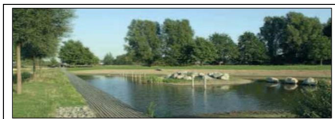
Wietzpark, Région de Hanovre.

En tant qu'autorité responsable de l'aménagement urbain, la Région a la charge d'élaborer un Programme d'Aménagement du Territoire . Le programme de 2005 se base sur le développement multipolaire du territoire. Il affirme que le développement urbain de la Région doit se fonder sur le système des lieux centraux , selon lequel on identifie des pôles de croissance principaux et secondaires et des pôles de croissance limités au niveau rural. A travers cette répartition, on souhaite définir une utilisation prioritaire des friches urbaines inutilisées et concentrer les résidences et les emplois dans les « lieux centraux » qui doivent être situés à proximité des arrêts de transports collectifs. Ces derniers doivent aussi garantir une bonne connexion entre les différents pôles de centralité.