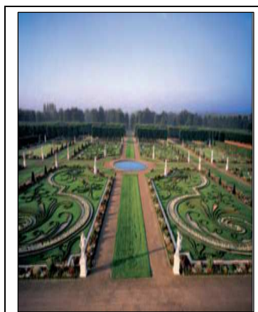
Le Grand Jardin.

La Région poursuit aussi l'objectif de sauvegarder les espaces naturels dans leurs différents usages (loisirs, maintien de la biodiversité et de l'activité agricole). Pour ce faire, on a défini des zones non constructibles de protection de l'environnement.